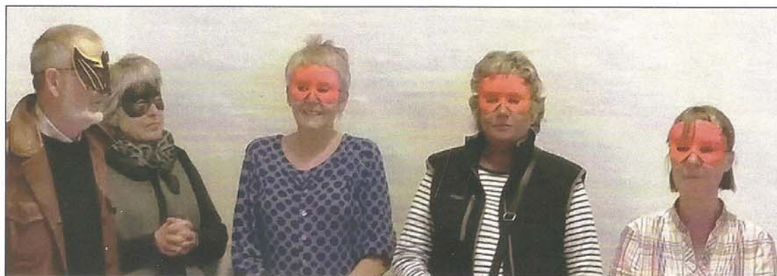
Efterårsudstillingen bød bl.a. på temaet "Masker". Møllestiens hårde kerne gemmer sig bag maskerne.