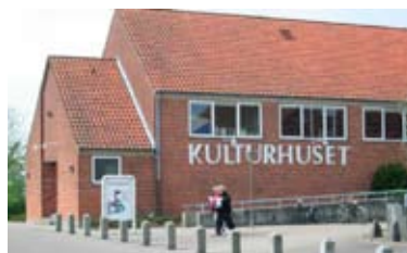
Kulturhuset i Helsingør og billeder fra forårsudstillingen 2008

Dato og klokkeslæt for aflevering, ophængning, fernisering, aftenarrangement og nedtagning finder du i kalenderen på bagsiden.