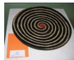
Keramikfad af Hanne Flyge