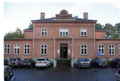
Tinghuset i Fredensborg

Der er planer om at gentage succesen til næste år, hvis der er interesse for det blandt medlemmerne, men det kommer der mere om til næste år.