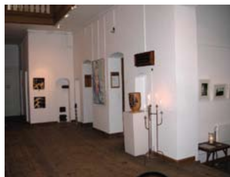
Trapperummet med de store malerier og keramik