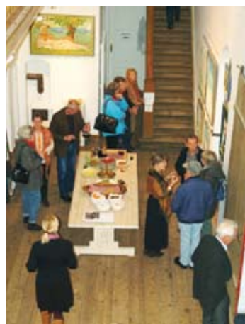
Fernisering med god stemning